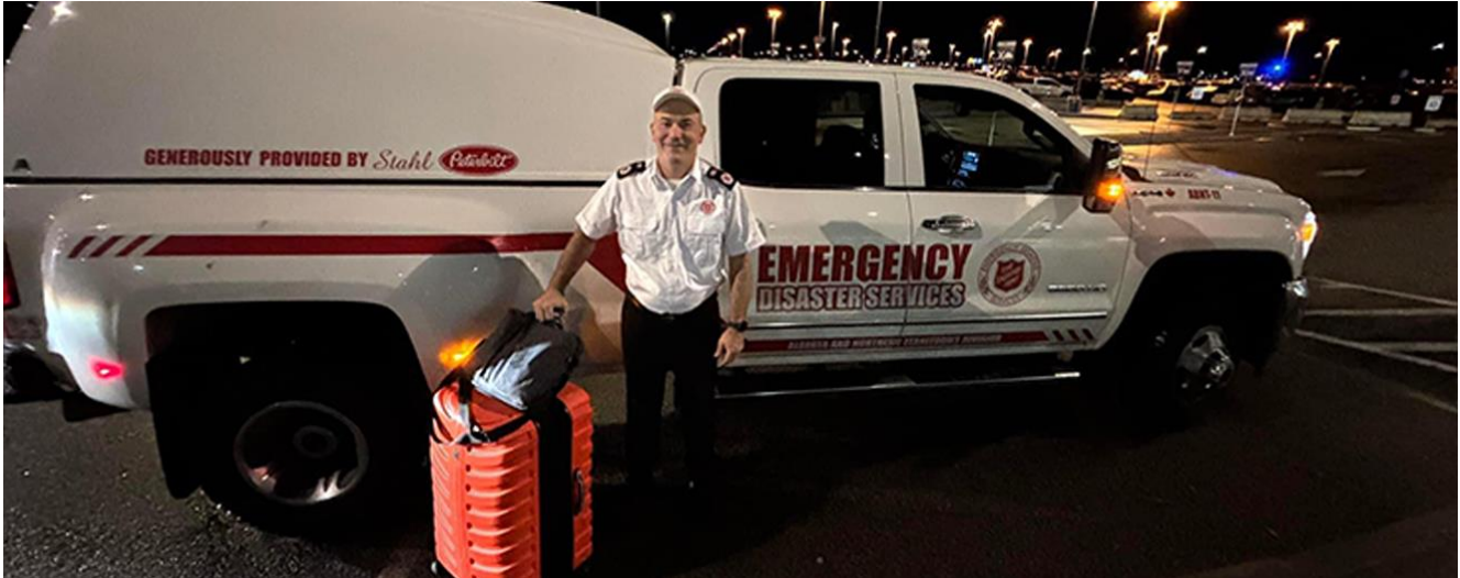
Every emergency disaster services deployment provides essential lessons in terms of what to pack and what to leave behind.