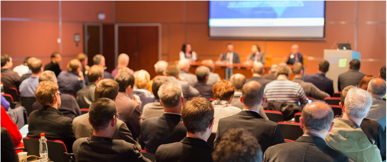
You're invited to the EDS Collaborative Preparedness Summit from February 24-28, 2025, in Toronto.