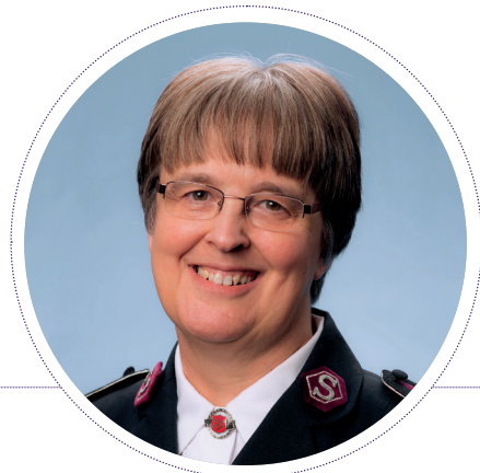
Commissioner WORLD PRESIDENT OF WOMEN'S MINISTRIES