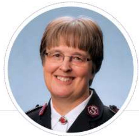
COMMISSAIRE PRÉSIDENTE MONDIALE DES MINISTÈRES FÉMININS